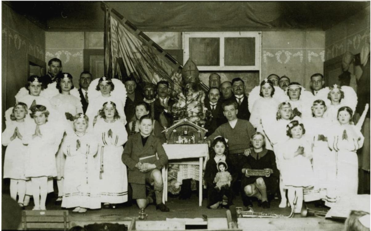
Kerstfeest van de Oud-Strijdersbond NSB in 1938 in de zaal Philips