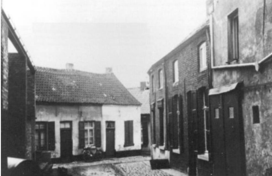
Oude huisjes in het Broekstraatje ter hoogte van Phlips begin vorige eeuw