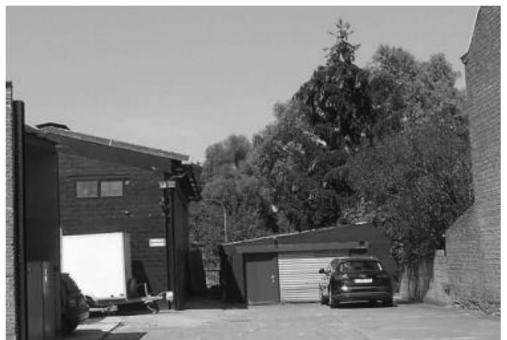
Links achter De Nieuwe Zaal (1908)

die de vensters van de voorgevel van de herberg nu nog steeds sieren, verwijzen duidelijk naar de functie als smidse die sedert 1785 de voornaamste bedrijvigheid uitmaakte van de familie Phlips. In 1908 werd achteraan een zaal bijgebouwd die met de Hombeekse zomerkermis op Sint-Jan feestelijk geopend werd onder de naam : "De Nieuwe Zaal ". Ze werd gebruikt voor toneelvoorstellingen, teerfeesten, zoals St.-