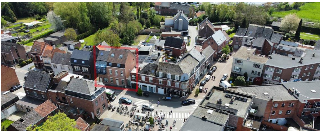
De huidige toestand.