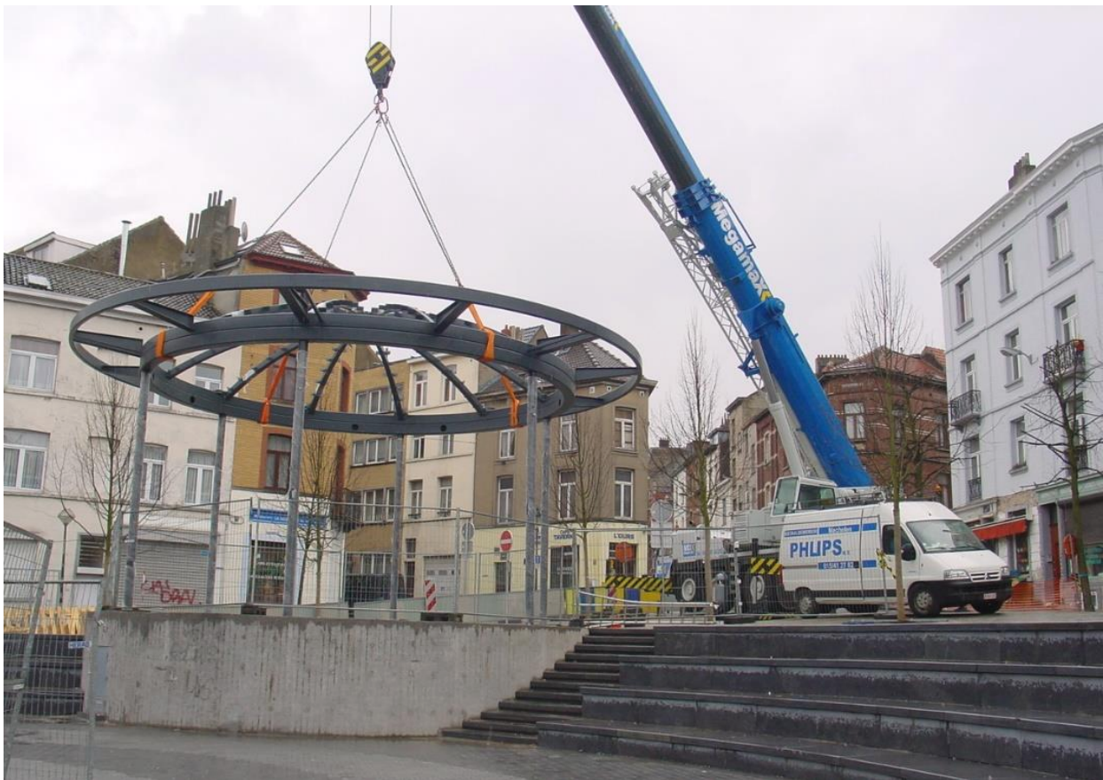
Productie en plaatsing van een kiosk op het Bethlehemplein in Brussel

Ook een opdracht voor het ontwerp en plaatsing van designbanken voor de inkomhal van de luchthaven werd met succes uitgevoerd. Op de foto het fraaie ontwerp van de zitbanken Philips N.V. met stalen zit - en rugleuning en houtafwerking.