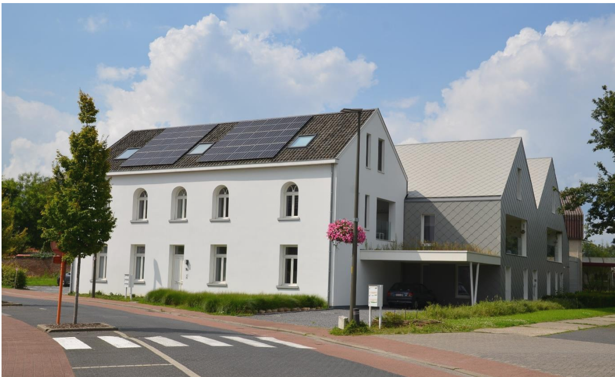
Situatie na de verkoop en verbouwing tot 6 woonheden in 2019